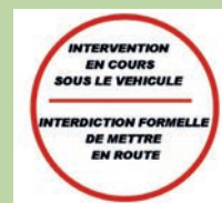
Signalétique de sécurité