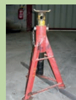
Chandelle de sécurité adaptée aux véhicules agricoles et industriels