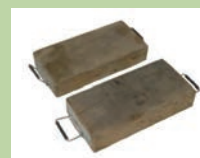
Plateaux en bois