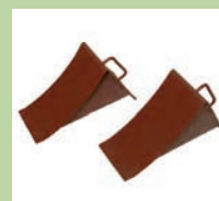
Jeu de cales