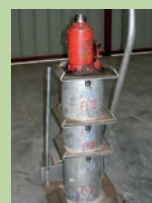
Cric 10 tonnes haute levée hydraulique ou pneumatique