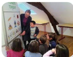
Un module Planetarisks dans le cher

→ Les délégués travaillent en équipe, ce qui facilite la mise en place d'actions.