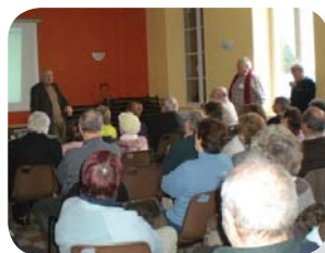
Une réunion d'information sur la prévention routière dans le loiret